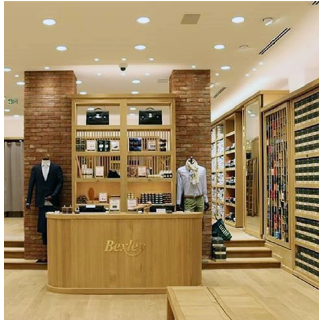
Réalisation des boutiques BEXLEY, spécialisées dans l'habillement et chaussures pour hommes.