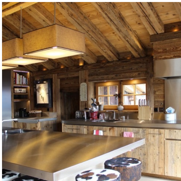
Rénovation complète d'un chalet de prestige de plus de 280m 2 situé à Verbier en Suisse.