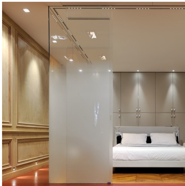
Rénovation d'un appartement design à Lyon.