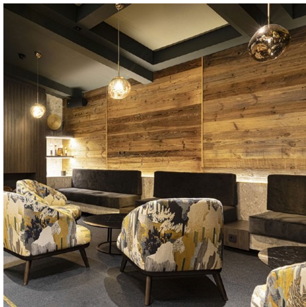
Réalisation des menuiseries et des agencements de l'hôtel 5 étoiles LE CHABICHOU à Courchevel.